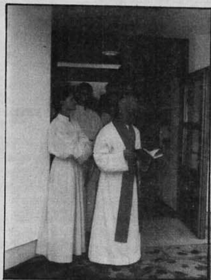
Einweihung des neuen Altersheimes, 1987