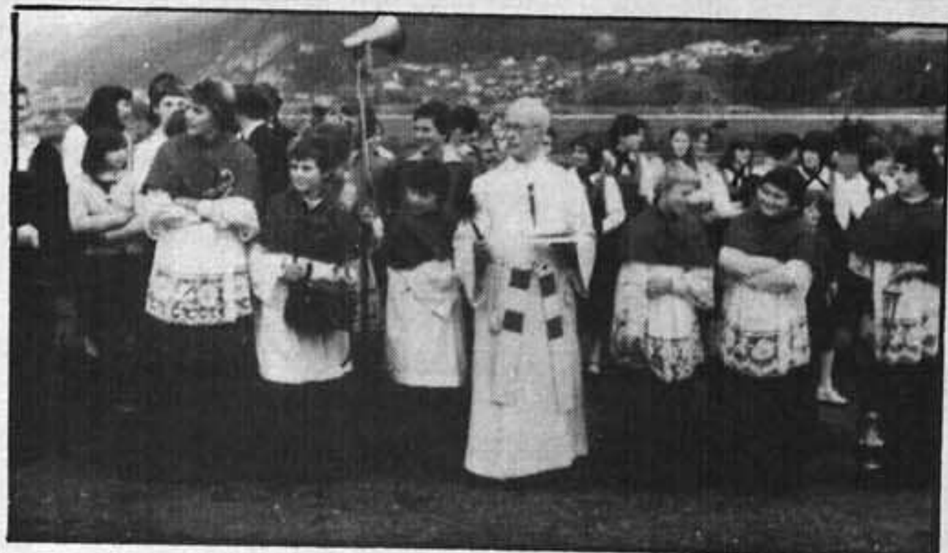
Weihe der Mur-Erinnerungskapelle, 1985