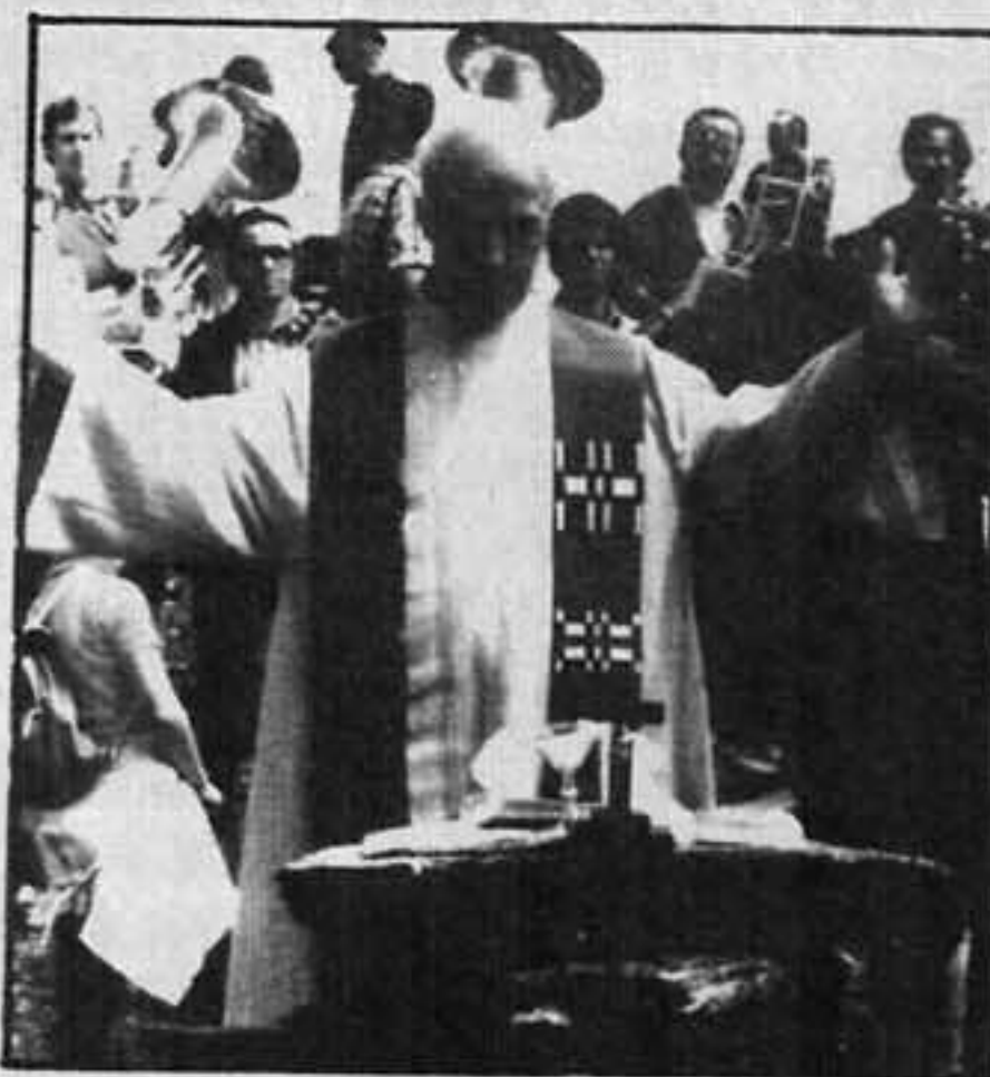
Gipfelmesse, umrahmt von der Musikkapelle, 1978