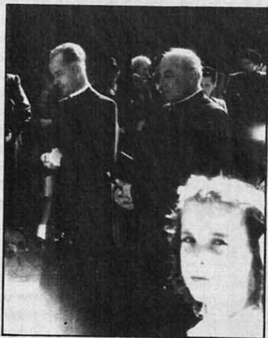
Empfang des neuen Seelsorgers 1953