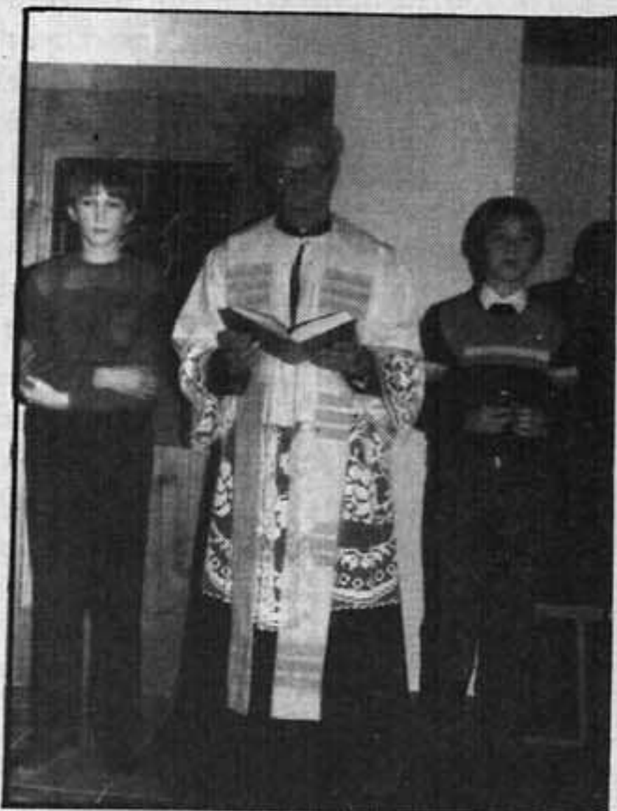
Einweihung des Schützenheimes, 1985