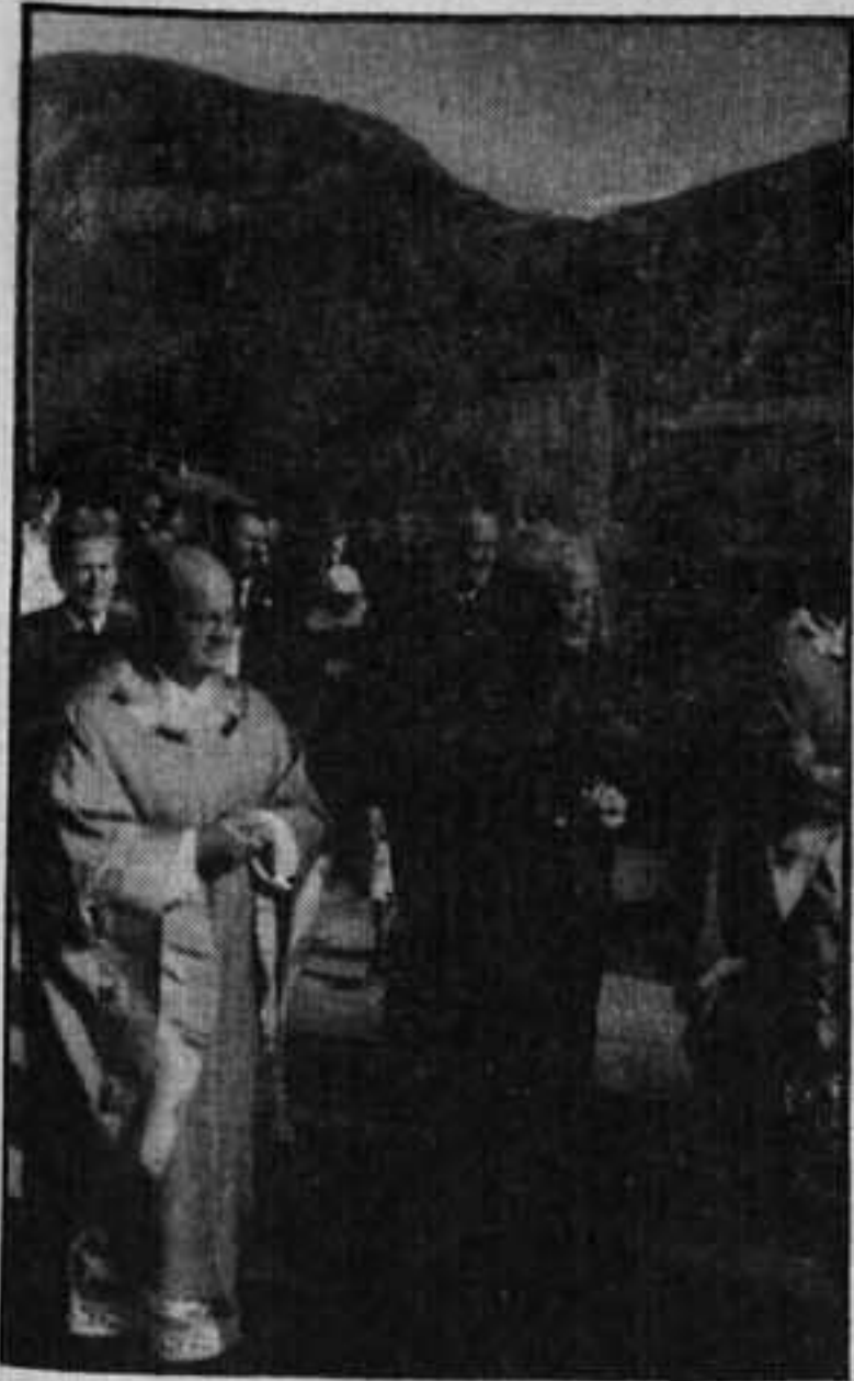
Abschied vom Seelsorgeamt, 1987