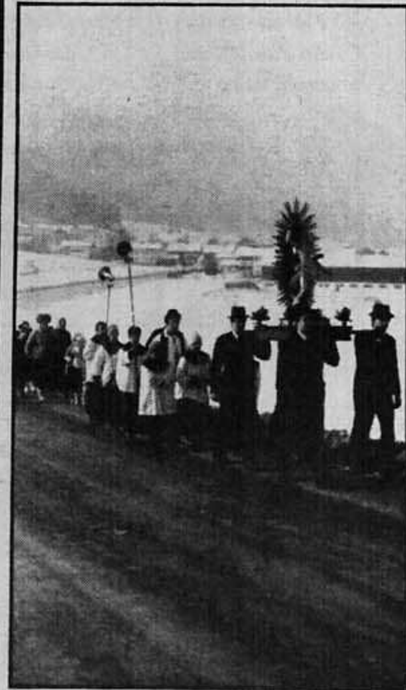
Sebastianikreuzgang nach Hatting, 1988