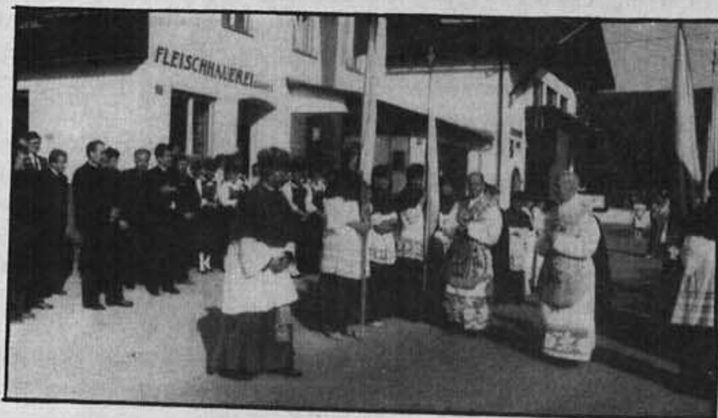
Empfang von Bischof Reinhold Stecher anlässlich der 300-Jahr Feier des Gnadenbildes, 1985